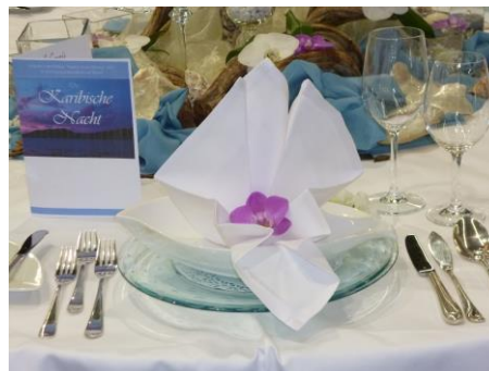
Gedeckter Tisch / Show-dining