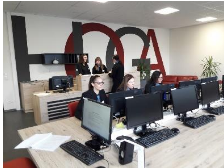
Büroorganisation / Rezeption

Die am BSZ Wiesau errichtete Berufsfachschule für gastgewerbliche Berufe ist für die Dauer des Schulbesuches berufsbildende Schule und Ausbildungsstätte zugleich. Sie bietet eine Entscheidungshilfe bei der Wahl des endgültigen Berufes innerhalb des gesamten Berufsfeldes, d. h. der Jugendliche entscheidet sich erst während des Besuches der Berufsfachschule für einen der fünf möglichen Ausbildungsberufe. Die gründliche Orientierung in der Berufsfachschule hilft herauszufinden, wo die einzelnen Interessen und Neigungen des Jugendlichen liegen.